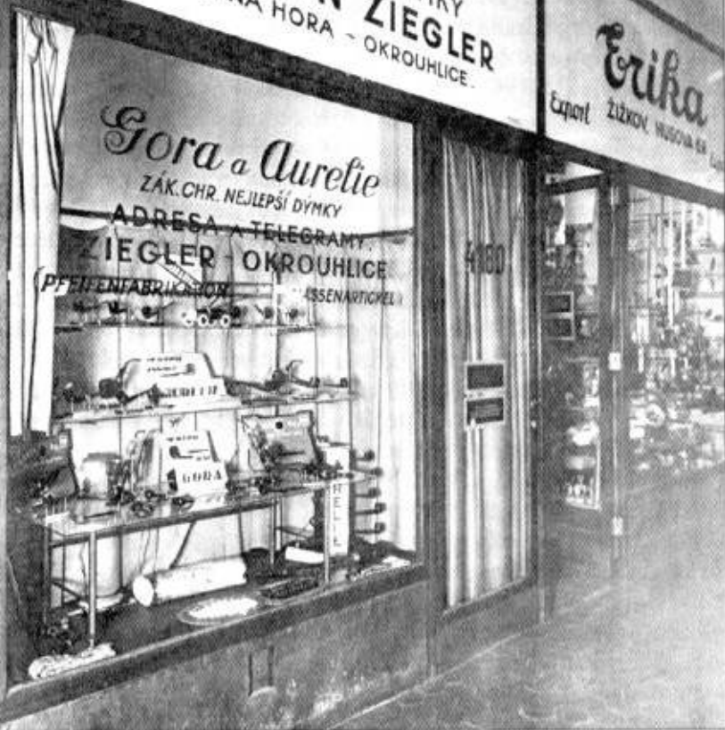
Tovární prodejna Gora v Praze v Seminářské ulici, doba první republiky