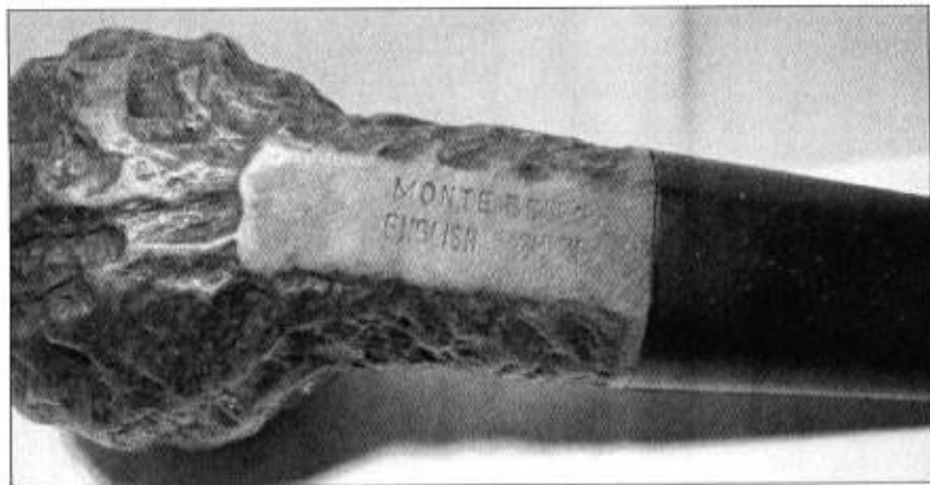
Dýmka zn. Monte Bello (2)