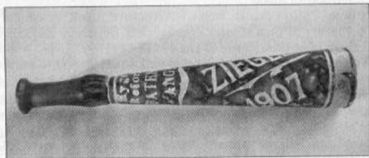
Špička na doutníky se šroubovacím náustkem z roku 1907