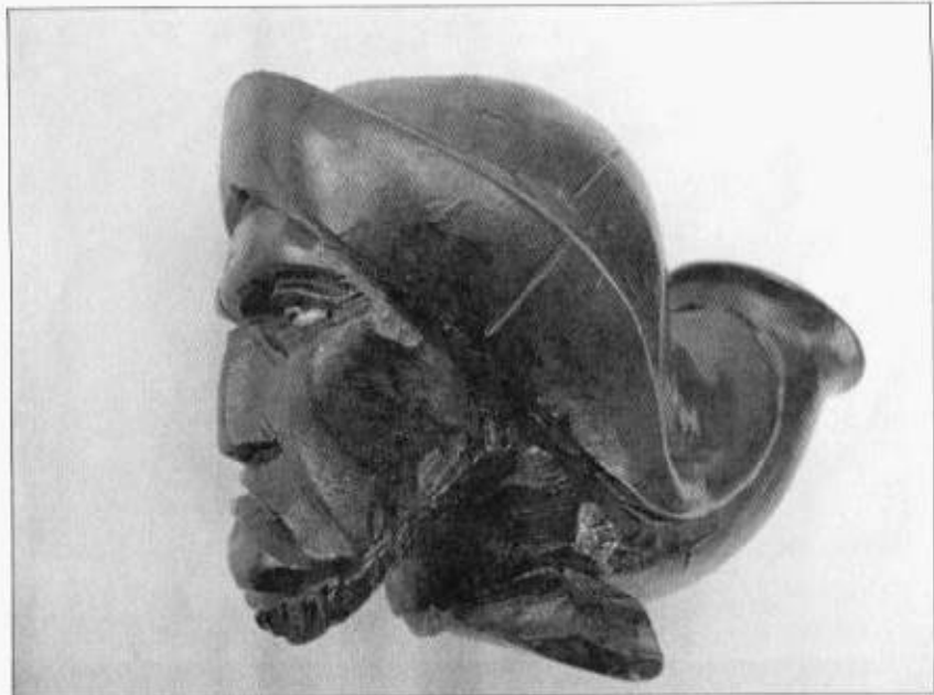
Hlavička dýmky v podobě vousatého muže, skleněné oči, po roce 1914