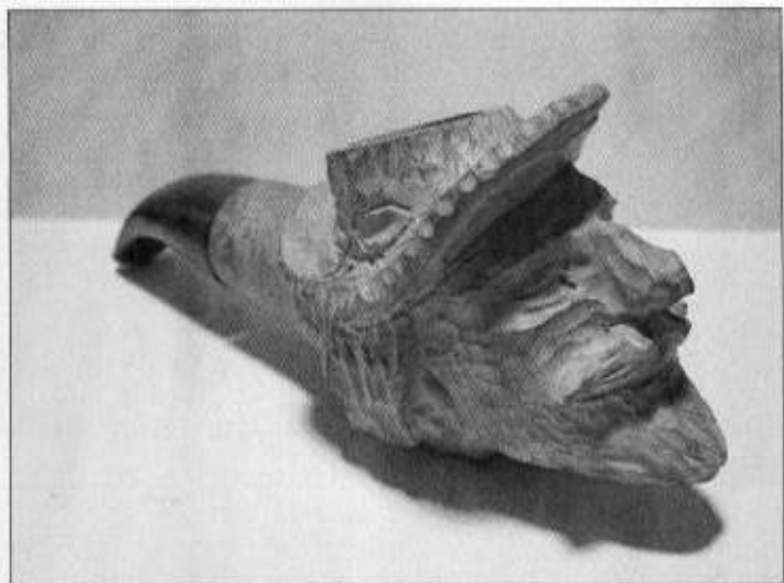
Řezbářský návrh dýmky od Antonína Zieglera