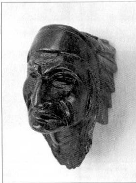
Hlavička dýmky v podobě indiána, po roce 1914